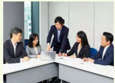
財務部のミーティングの様子