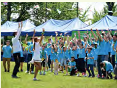
春の運動会の様子