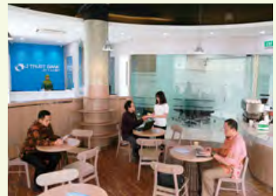
インドネシアのカラワン-KIIC支店(プレミアムコーヒーを提供するエグゼクティブラウンジ)

ウェブサイトでは、視覚が不自由な方向向けの「音声読み上げ機能」をはじめ、英語・韓国語の多言語対応、スマートフォンサイトの開設などにより、ユーザビリティ向上に努めています。