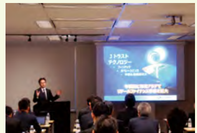
決算説明会の様子