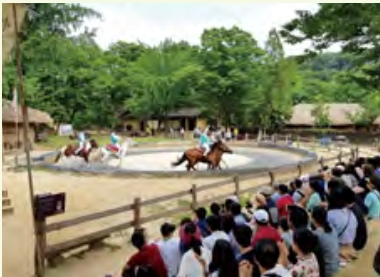
「幸せいっぱい」の文化体験Dayの様子