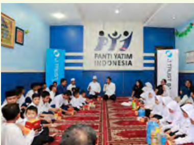
断食明け食事会の様子