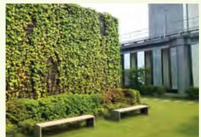
本社ビルの屋上緑化

Jトラストグループは「エコキャップ運動」に参加しています。「エコキャップ運動」とは、ペットボトルのキャップを回収してリサイクルするとともに、その売却益で途上国の子どもたちにワクチンを贈る運動です。