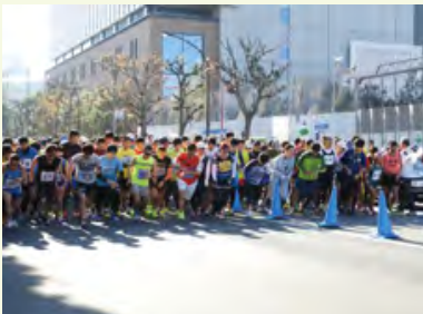
障がい者と健常者による盲人マラソンの様子