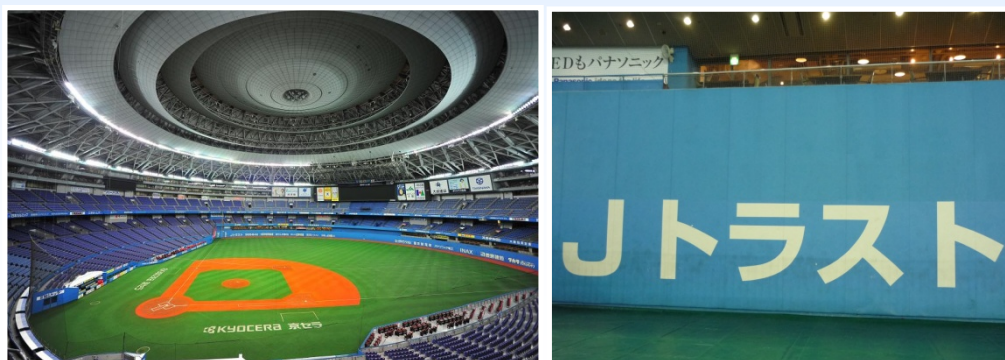
※ 京セラドーム看板（レフトフェンス）