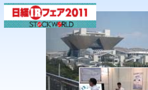
東京ビッグサイト IRフェア風景